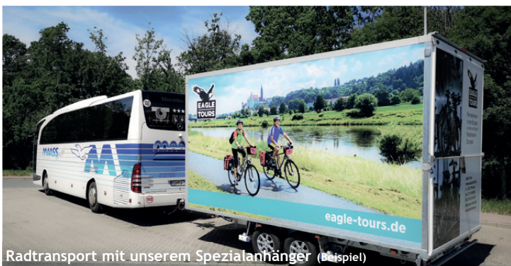
Radtransport mit unserem Spezialanhänger (Beispiel)

Programmänderung aus wichtigem Grund vorbehalten!